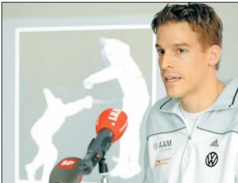
Marcel Fischer a annoncé sa retraite sportive, hier à Bienne.

«J'ai décidé de franchir le pas. Mon nouveau travail est la seule raison qui motive mon arrêt», a déclaré le plus capé des escrimeurs suisses, le seul à avoir gagné cinq tournois de Coupe du monde (le dernier en 2005), ainsi qu'un titre olympique, à Athènes en 2004, plus un titre européen par équipes en 2004. «J'aurais pu certes travailler à temps réduit et continuer en parallèle le sport d'élite, mais je n'aime pas faire les choses à moitié.» Le Biennois aura aussi plus de temps