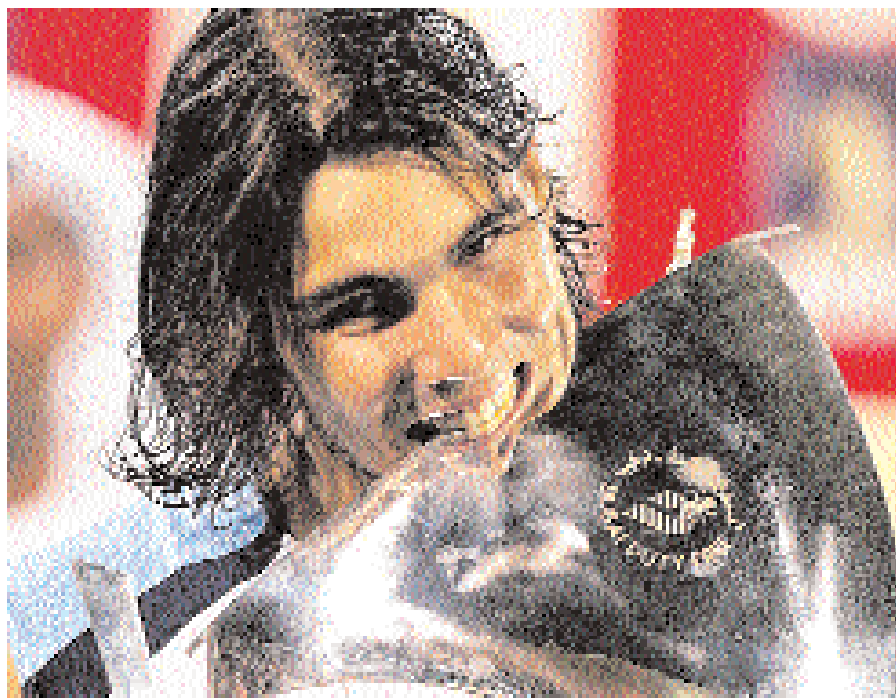
Après de longs mois d'absence, Rafael Nadal avait faim de tennis.